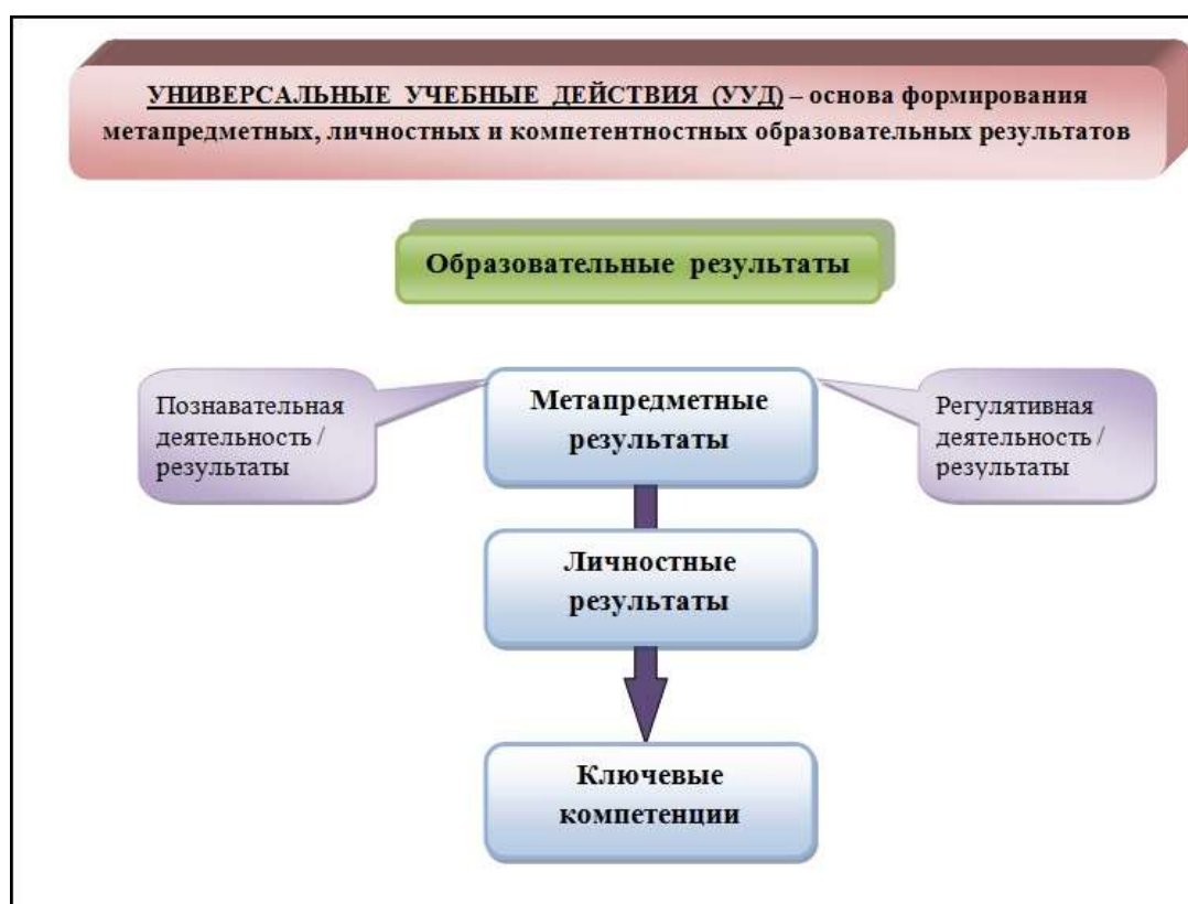
Рис. 3. Система оценки образовательных результатов

Система оценки достижения планируемых результатов освоения основной образовательной программы основного общего образования предполагает комплексный подход к оценке результатов образования, позволяющий вести оценку достижения обучающимися всех трёх групп результатов образования: личностных, метапредметных и предметных (рис.3)